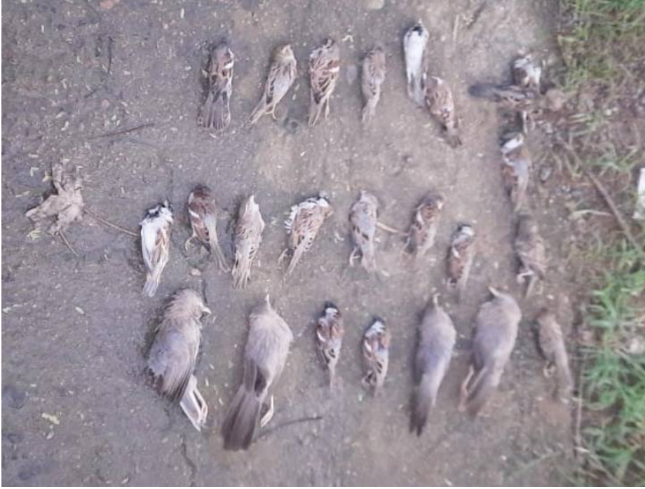
मृत पड़ीं चिड़िया।

ग्रामीणों के अनुसार रोजाना की तरह गांव के पेड़ों पर रात गुजारने वाली चिड़िया मंगलवार शाम भी पेड़ों पर आकर बैठ गई। चिड़ियों के चहचहाने की आवाज के बीच देर शाम पेड़ पर बैठी चिड़ियों का जमीन पर गिरना शुरू हुआ। यह सिलसिला रात भर चलता रहा। ग्रामीणों की मानें तो सुबह तक करीब 200 चिड़ियों की मौत हो गई। अचानक हुई इन मौतों से गांव में दहशत फैल गई। मामले की जानकारी तत्काल पशु चिकित्सा विभाग को दी गई।